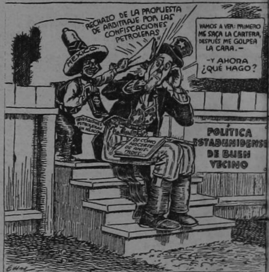
La Política de Buen Vecino

(Del "Columbus Dispatch" de Columbus, Ohio)